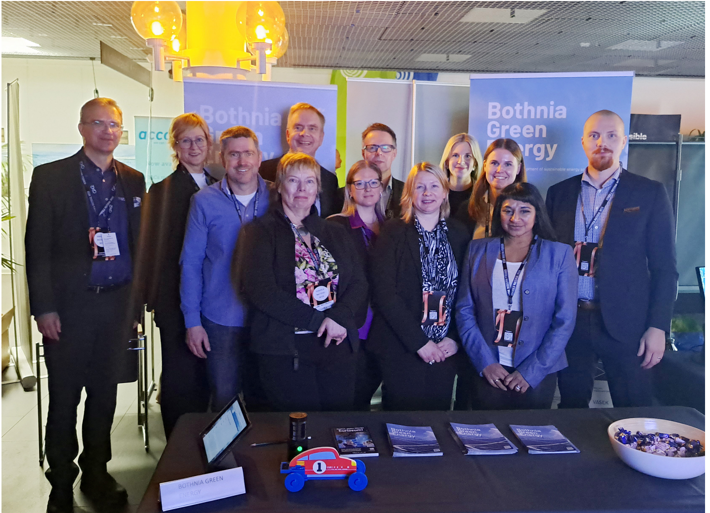
Bothnia Green Energyn projektiryhmä Kokkola Material Week-tapahtumassa.